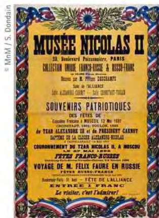
Affiche du musée Nicolas II