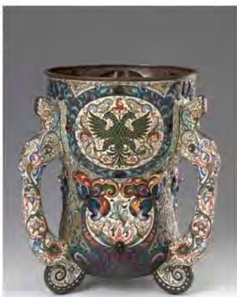
Bratina / Maison Ovtchinnikov