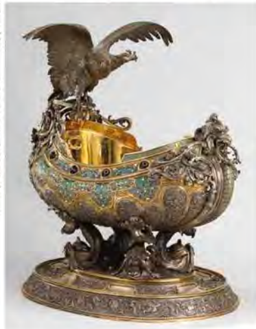
Bratina / Andreï S. Braguine

© MnM (Coll. Cercle national des Armées) / A.Fux