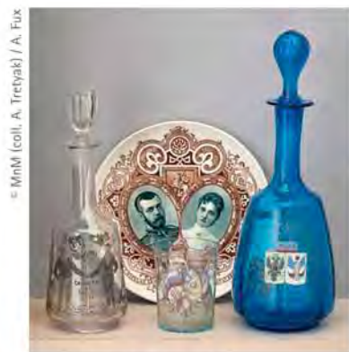
Ensemble de carafes, verre, assiette