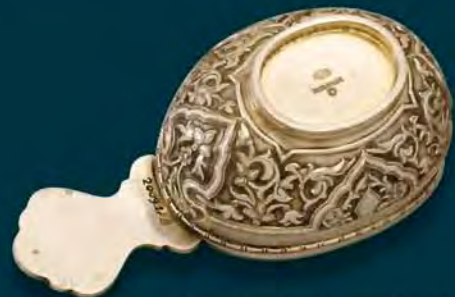
Kovsh appartenant au service à punch Frères Gratchev