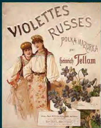
« Violettes russes », polka mazurka Heinrich Tellam