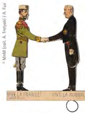
Nicolos II et Félix Faure se serrant la main Jouet