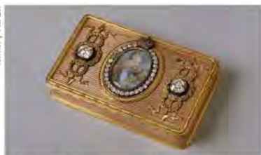
Boîte à l'effigie d'Alexandre III / Maison Fabergé