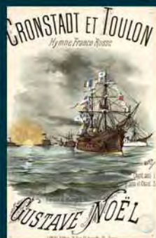
« Cronstadt et Toulon », hymne franco-russe / Gustave Noël