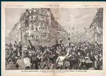
Le journal illustré, les fêtes franco-russes