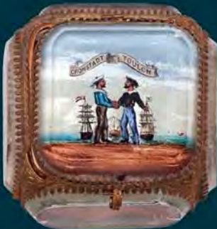
Boîte à bijoux