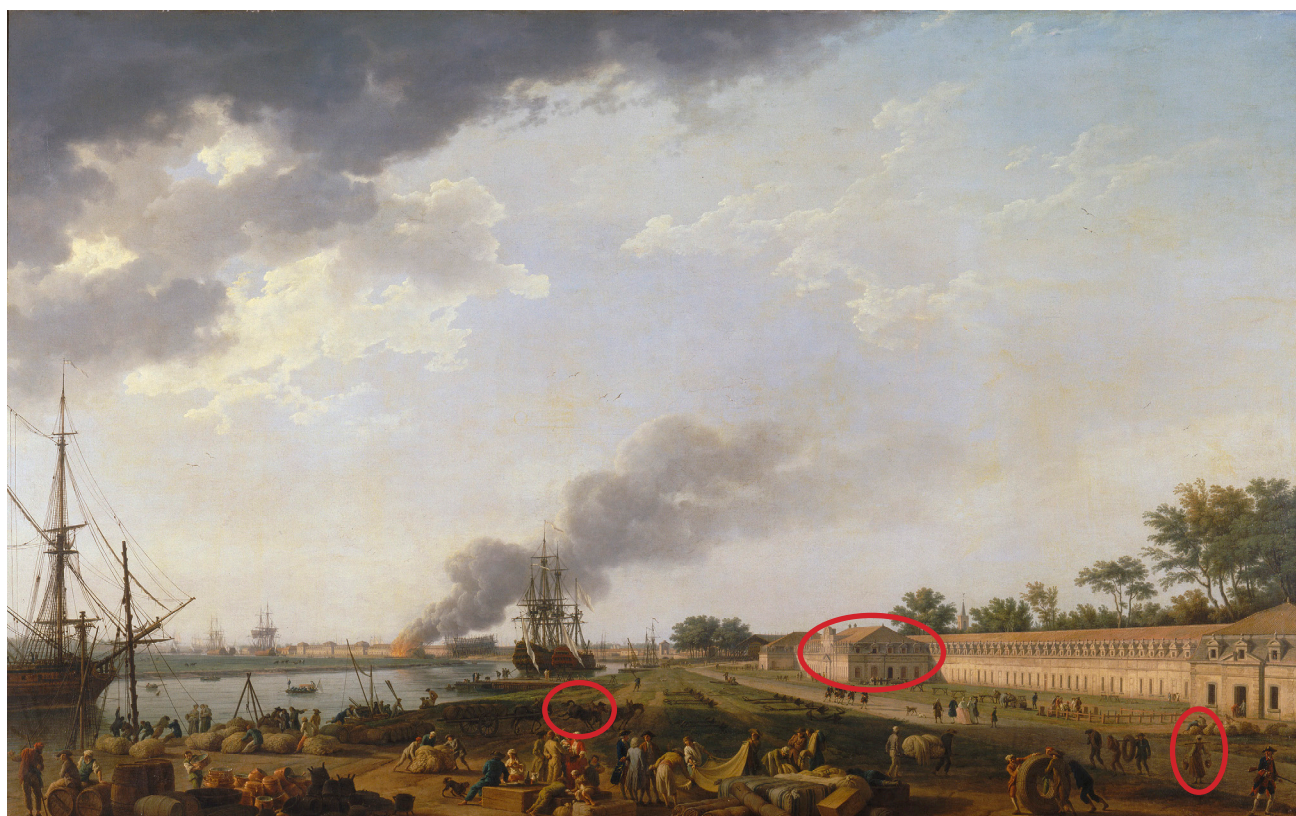
Vue du port de Rochefort, Joseph Vernet, 1762 © Musée national de la Marine

Jeu page 7 Trouve 3 détails dans la reproduction du tableau de Joseph Vernet :