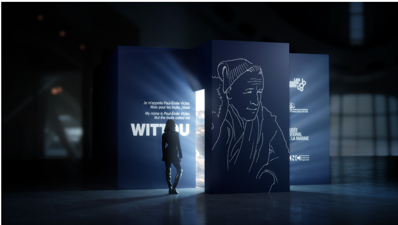
Vue d'artiste de l'entrée de l'expérience immersive « Wittou »