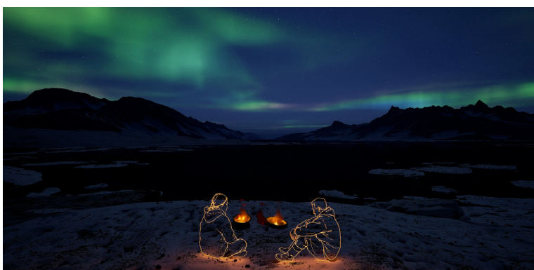
Paysage et dessins créés avec l'aide de l'intelligence artificielle