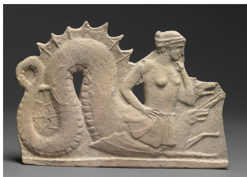
Plaque de Milo représentant Scylla Vers -475 / -450 av. J.-C. ; Mélos (Grèce) ; argile Musée du Louvre, Département des Antiquités grecques, étrusques et romaines, Paris