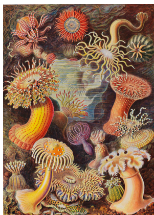
Kunstformen der Natur / Von Prof. Dr. Ernst Haeckel [Formes artistiques de la nature] Ernst Haeckel (1834-1919), Bibliographisches Institut Leipzig, Allemagne, auteurs ; 1899-1904 Musée national de la Marine