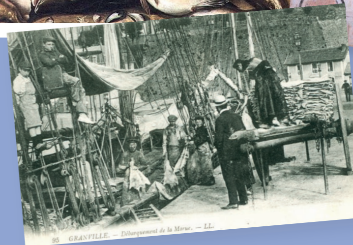
95 GRANVILLE. — Débarquement de la Morue. — LL.