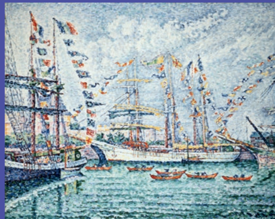
▲ Saint-Malo, le pardon des terre-neuvas Paul Signac (1863-1935) Huile sur toile, 1928 Musée d'Histoire de Saint-Malo