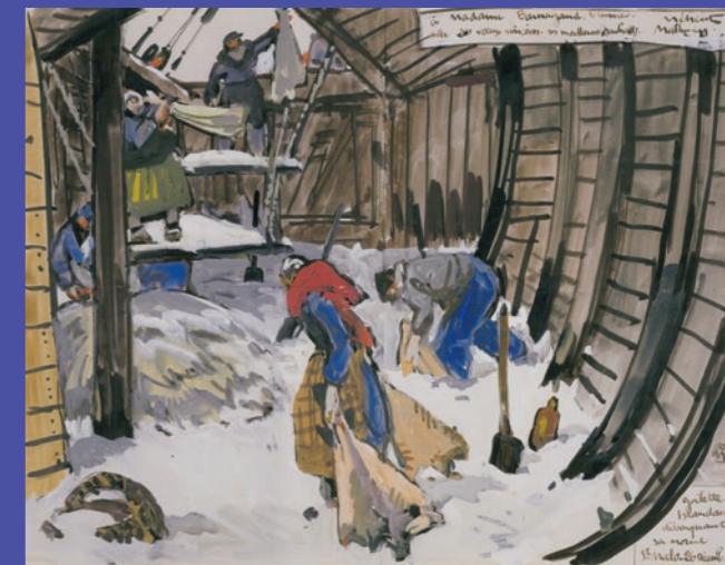
▲ Golette islandaise débarquant sa morue Mathurin Méheut (1882-1958) 1939