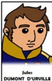
Jules DUMONT D'URVILLE

Son tragique naufrage en 1788 reste un mystère jusqu'à la découverte des épaves en 1964.