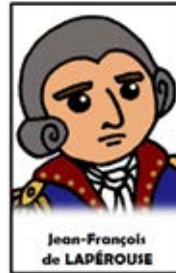
Jean-François de LAPÉROUSE

C'est la première femme à avoir fait le tour du monde ! Déguisée en homme sous le nom de Jean Barret, elle se fait passer pour un assistant du naturaliste Philibert Commerson et prend part à l'expédition de Bougainville de 1766 à 1769.